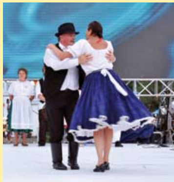
Magyar táncot járunk feleséggel Vietnámban

Ifjú korom óta szenvedélyes néptáncos vagyok. Korábban aktívan táncoltam, később tánctanítással, csoportvezetéssel, rendezvények szervezésével, támogatásával foglalkoztam. Azért, ha tehetem, ma is szívesen táncolok, és népszerűsítom a magyar hagyományokat, amint ezt tettem a nyáron Vietnámban, szeptemberben Monoron, a Kistérségi Népzenei és Néptáncalálkózón, melynek szervezője voltam vagy augusztusban Üllőn, a nyári napközisek és az árvízkárosult vendégek programjain.